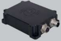
Sensor de aceleración