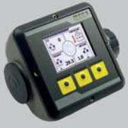
Pantalla a color GDC-320